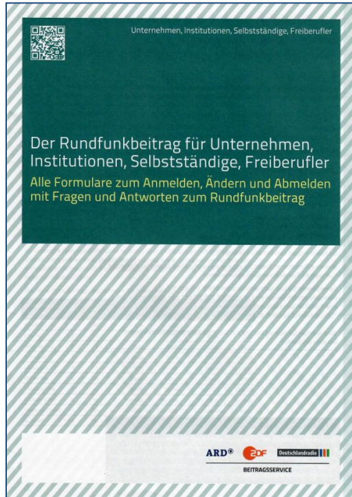
Formulare für Unternehmen, Institutionen, Selbstständige, Freiberufler, DIN A4, 20-seitig