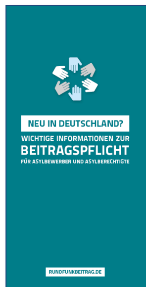
Kurzinformationen für Asylbewerber und Asylberechtigte Flyer, DIN lang (hoch)