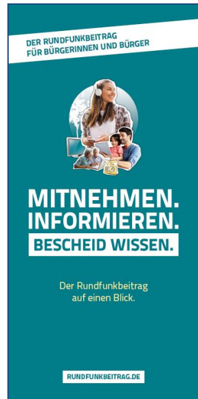
Kurzinformationen für Studentinnen und Studenten (5), Unternehmen, Institutionen und Einrichtungen des Gemeinwohls (6), Bürgerinnen und Bürger (7) – Flyer, DIN lang (hoch)