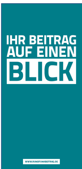
Kurzinformationen für Gerichtsvollzieher Flyer, DIN lang (hoch)