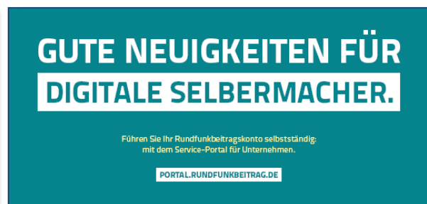
Kurzinformationen zum Serviceportal Flyer, DIN lang