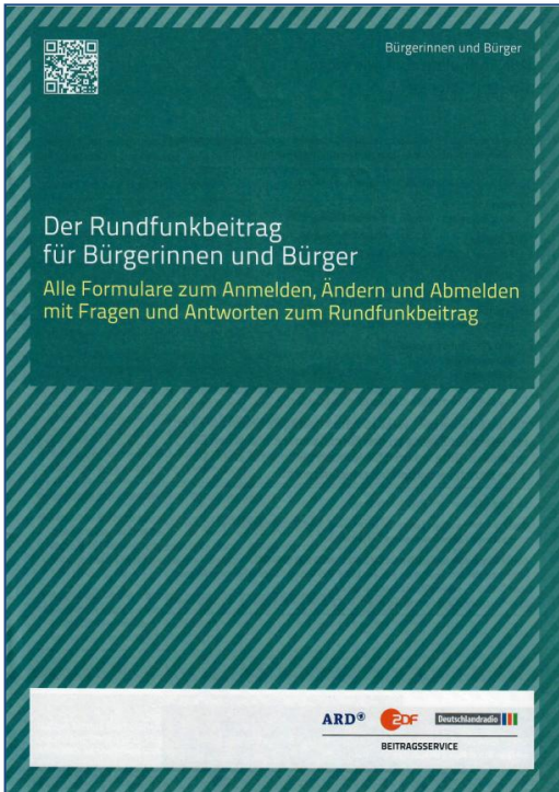
Formulare für Bürgerinnen und Bürger, DIN A4, 12-seitig