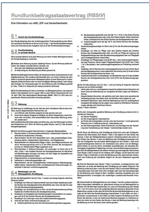
Rundfunkbeitragsstaatsvertrag DIN A4, 4-seitig